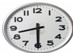
De deuren gaan dicht.