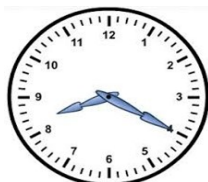
De deuren gaan open

De samenwerking tussen ouders en school is essentieel voor de ontwikkeling van uw kind, ook in deze!