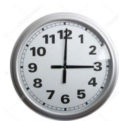
De deuren gaan open